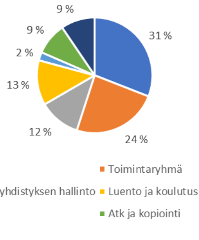
Tilavarauksien käyttötarkoitukset 2025

Lokakuussa 2025 teetetyin kävijäseurannan (1.–31.10.) tuloksien valossa kokonaiskävijämäärät ovat pysyneet edellisen vuoden tasolla. Kävijöitä kirjattiin yhteensä 914 henkilöä seurankuukauden aikana (+1,3 %).