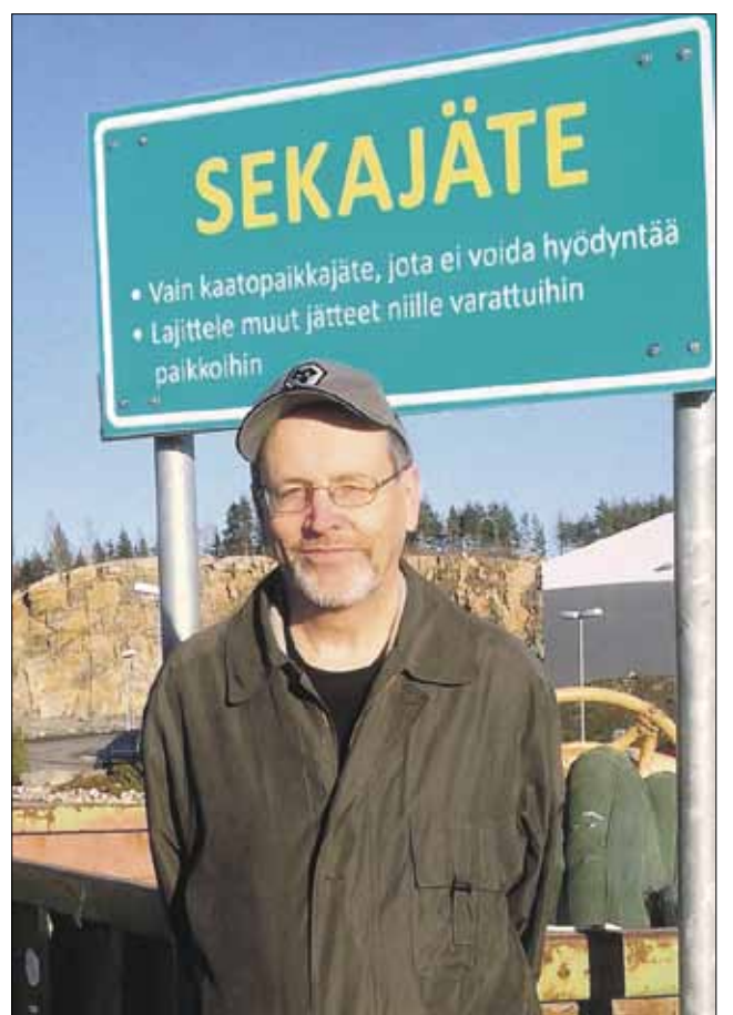
Kroonikko joutuu monenlaisiin tilanteisiin, muttei lanistu. Tästäkin selviydettiin ja pääsin kotiin.

Kotiutumislennon jälkeen kapuan alas koneesta ja istahdan odottavaan tuoliin. Nostan matkalaukkuni jalkatukiin päälle ja kynnärsäuvaa syliini. Eiköhän lähdetä, sanoo takanani seisova