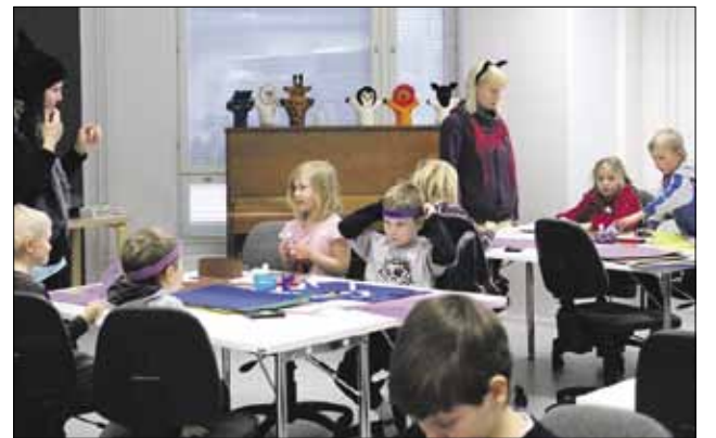
Reumalasten puuhapäivä 2013.