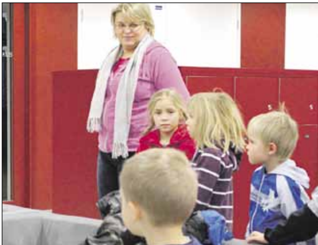
Reumalasten puuhapäivä 2013.

http://adhd-salo.fi/ https://www.facebook.com/SalonSeudunAdhdYhdistys adhdyhdistys@gmail.com