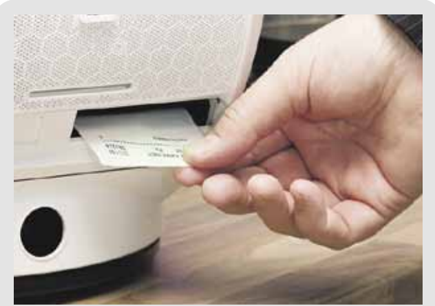
Lääkeautomaatti on Evondos®-palvelun yksi tärkeä osa.