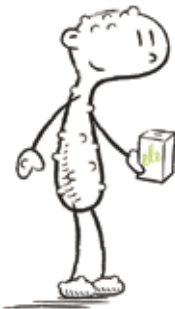
ALLERGIA- JA ASTMALIIITTO