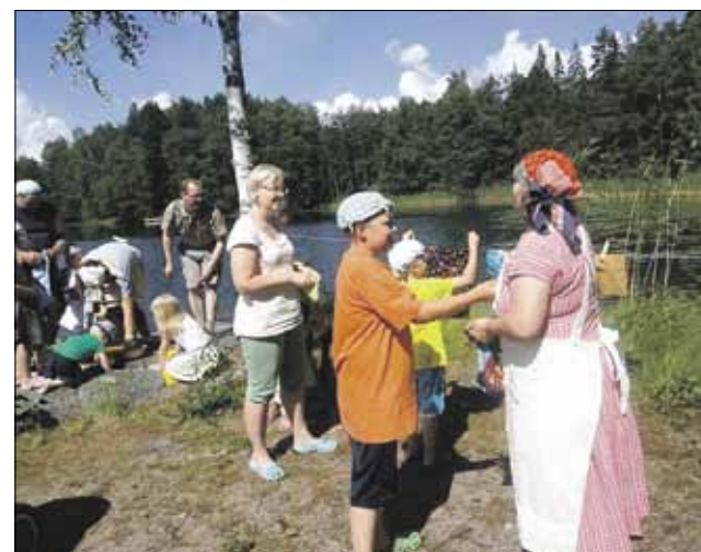
Salon Hengitysyhdistyksen leiriltä

Osallistumme myös koko yhdistyksen erilaisiin tapah-